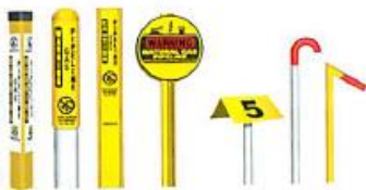
From left to right: TriView™ Marker, Dome Marker, Flat Marker, Round Marker, Aerial Marker, Casing Vent Markers.

Although not present in certain areas, these can be found at road crossings, fence lines, and street intersections. The markers display the product transported in the line, the name of the pipeline operator, and a telephone number where the operator can be reached in the event of an emergency.