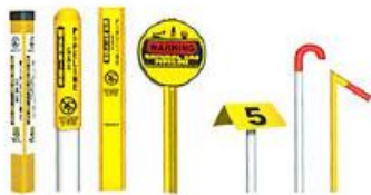
De izquierda a derecha: Marcador TriView™, Marcador Domo, Marcador Plano, Marcador Redondo, Marcador Aéreo, Marcadores de Tubos de Ventilación.

Aunque no siempre están presentes en ciertas áreas, estos marcadores se pueden encontrar en los cruces de ferrocarriles, las cercas y en las intersecciones de calles. Los marcadores muestran el producto que es transportado en la línea, el nombre del operador de la línea de tuberías y un número de teléfono donde puede contactar al operador en el caso de una emergencia.